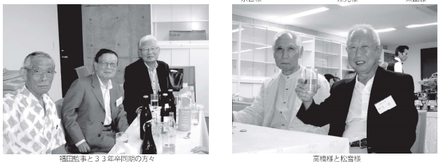
福田監事と33年卒同期の方々