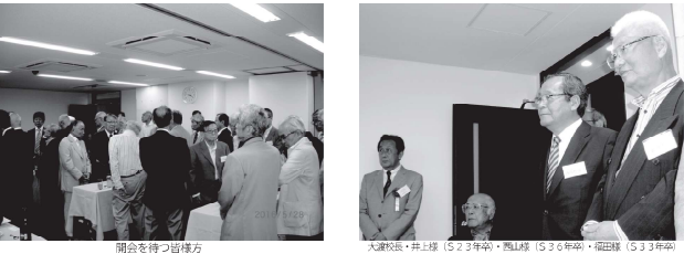
開会を待つ皆様方