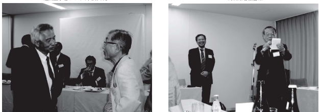
横尾会長 田宮前会長(相談役)