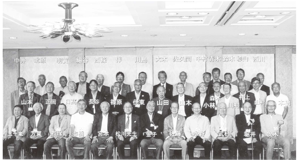
2016(平成28)年10月2日(日) 明大中野高校昭和42年卒同期会 新宿京王プラザホテル